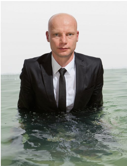
Henk Ovink, watergezant

Niemand begrijpt dit beter dan Henk Ovink, watergezant van Nederland. Hij presenteerde 24 september 2019 voor de Global Commission on Adaptation in New York zijn integrale aanpak via zes thema’s: voedsel, natuur, steden, infrastructuur, rampenaanpak en water als zesde thema, dat alle andere thema’s verbindt . nrc 5 oktober 2019. Dit getuigt van visie die HHNK en ministerie Infrastructuur en Waterstaat node missen.